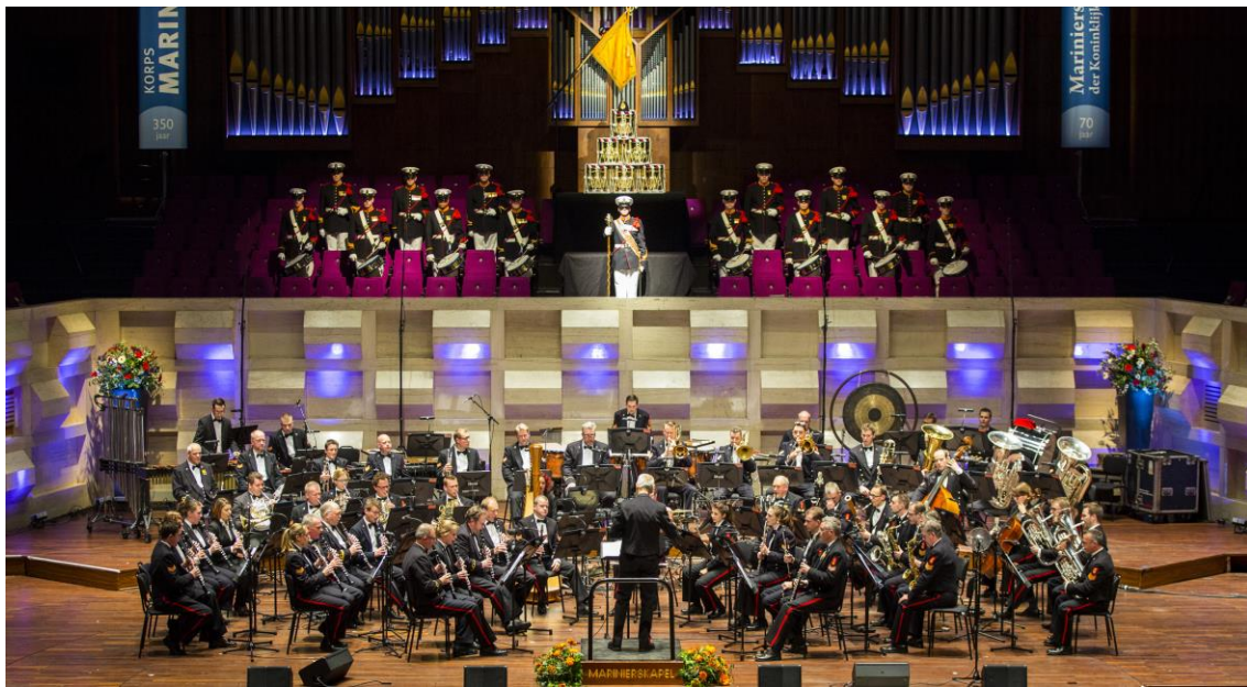
De volledige Marinierskapel (speciaal genomen foto in de Doelen)

Ze treden op in uniformen en als ze buiten optreden dragen ze ook nog een witte pet.